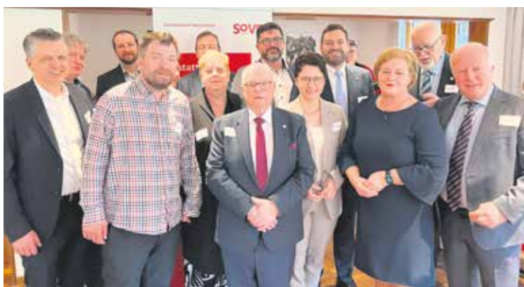
Gruppenbild mit den Gästen der Landesverbandstagung.