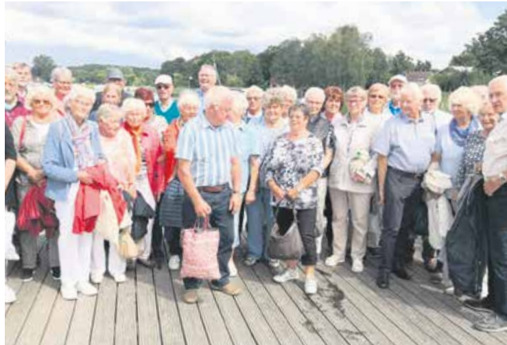
Nach zweistündiger Schifffahrt kam die Gruppe am Schloss Rheinsberg an.

Die mehr als zweistündige Schiffstour mit der „Stadt Mirow“ führte nicht nur über 16