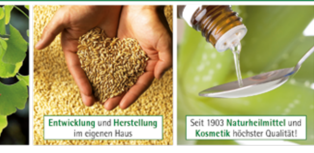
Entwicklung und Herstellung im eigenen Haus