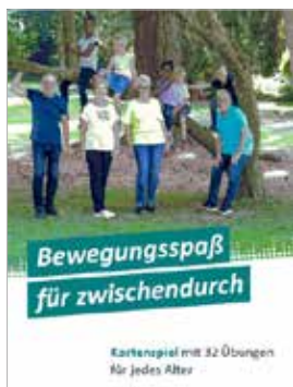
Kartenspiel der BzgA

Bewegung fördert Gesundheit und Wohlbefinden. Das gilt für Kinder und Jugendliche ebenso wie für Erwachsene. Ein Kartenspiel animiert Jung und Alt, sich auf spielerische Weise zu bewegen – drinnen und draußen. Es enthält 32 Bewegungskarten, untergliedert in acht Kategorien mit je vier Übungen: Bewegungsspiele - Entspannung und Achtsamkeit - Rücken und Bauch - Kopf und Nacken - Beine und Füße - Arme und Schultern - Koordination und Balance - Dehnung. Das Spiel kann kostenlos bei der Bundeszentrale für gesundheitliche Aufklärung bestellt werden.