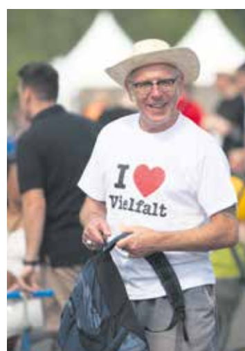
Diese Sportveranstaltung zeigt, dass Inklusion funktioniert.

Wer sich selbst bewegen möchte, kann sich weiterhin anmelden – es gibt noch freie Startplätze. Teilnehmende können ihre Unterlagen vorab in der SoVD-Bundesgeschäftsstelle abholen. Bei einer Anmeldung