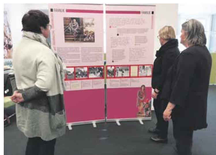
Die Ausstellungstexte wurden mit Interesse durchgelesen.

Nach dem Rundgang durch die Ausstellung kamen die anwesenden Frauen ins Gespräch, Erinnerungen wurden wach, „Ja so war es“, war die einstimmige Meinung und an anderer Stelle „War es wirklich so?“