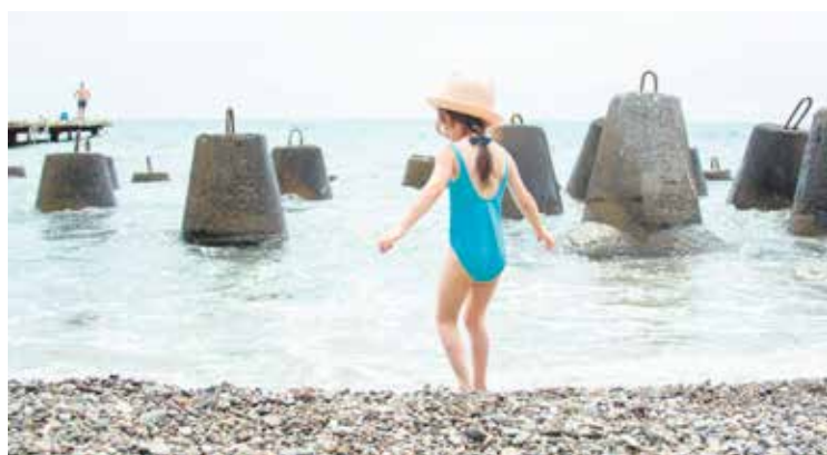
Grafik: Артем Барынин / Adobe Stock

Die DLRG bietet Schwimmkurse an und sucht immer ehrenamtliche Rettungsschwimmer*innen. Quelle: bg, DLRG